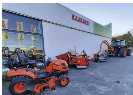
Produits et services pour espaces verts, cultures spéciales (noix), collectivités, agriculture

*CLAAS a repris Renault Agriculture en 2003, il y a 20 ans.