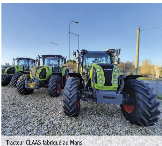
Tracteur CLAAS fabriqué au Mans